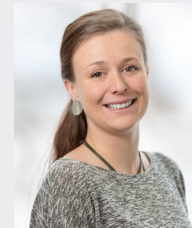
Kreißsaal (07651) 29-457