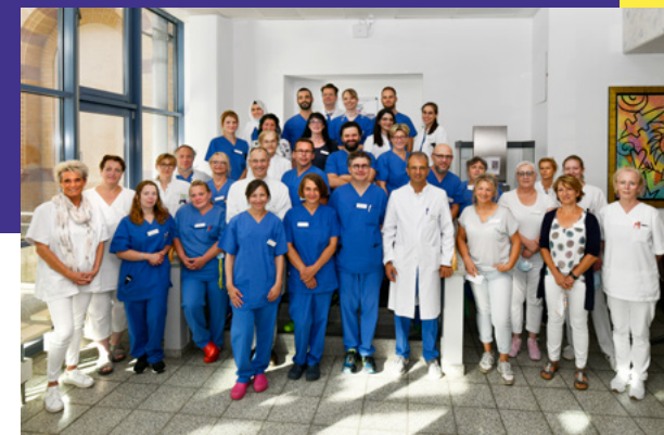
Das Team der Kardiologie

Das Herz ist unser wichtigster Muskel: Es pumpt lebenswichtiges Blut durch den Körper und gewährleistet so einen gesunden Kreislauf. Tritt eine Erkrankung am Herzen auf, kann diese schnell lebensbedrohlich werden. Begeben Sie sich deshalb nur in die besten Hände – Lernen Sie die Experten unseres Herzzentrums kennen!