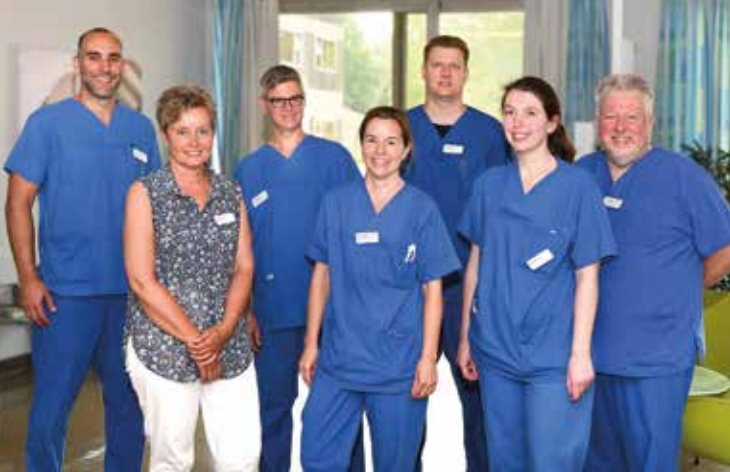
Das Team der Klinik für Allgemein- und Viszeralchirurgie