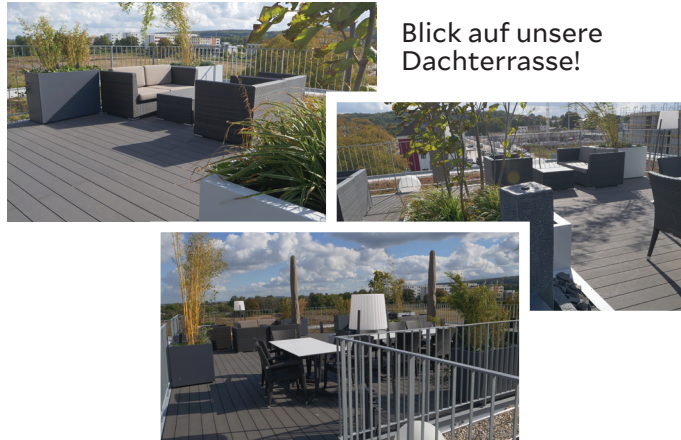
Blick auf unsere Dachterrasse!